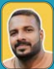
ലക്കി പ്രദേഷ് തിരുവനന്തപുരം

അടിസ്ഥാന പ്രശ്നം പാപവും ക്ഷമയും നമ്മുടെ നിത്യ വിധിയുമാണ്. ഒരാൾ അന്ധനായാലും മറ്റേതെങ്കിലും വിധത്തിൽ വൈകല്യമുള്ളവനായാലും, നമ്മുടെ വ്യക്തിപരമായ ജീവിതത്തിൽ നമുക്ക് എത്ര വലുതായാലും, ഇത് ദൈവത്തിന്റെ പ്രധാന പ്രശ്നമല്ല. ദൈവത്തിന് കഷ്ടപ്പാടും കഷ്ടപ്പാടിനോടുള്ള നമ്മുടെ പ്രതികരണവും അവന്റെ മഹത്വത്തിനും അവനെ അറിയാൻ നമ്മെ സഹായിക്കുന്നതിനും ഉപയോഗിക്കാൻ കഴിയും, ഉപയോഗിക്കുകയും ചെയ്യുന്നു.