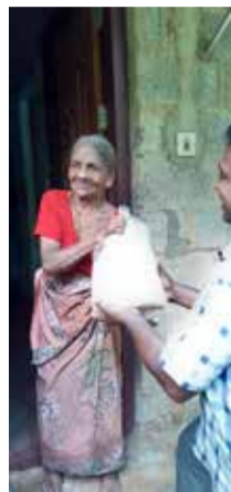
സോൾവിന്നേഴ്സ് ഇൻഡ്യയുടെ നേതൃത്വത്തിൽ കേരള

തിരുവനന്തപുരം/ഇടുക്കി: കൊറോണ മഹാവിദ്വേഷത്തിന്റെ പശ്ചാത്തലത്തിൽ ലോക്ക് ഡൗൺ പ്രഖ്യാപിച്ച കാരണത്താൽ ലോകത്തിലെ മുഴുവൻ ജനങ്ങളും കഴിഞ്ഞ രണ്ട് മാസമായി വീട്ടിൽ ഇരിക്കുകയാണ്. ആളുകൾക്ക് പരിചിതമല്ലാത്ത ഒന്നാണ് ലോക്ക് ഡൗൺ. സമരത്തിന്റെ പേരിലും, ഇതര സാധാരണ ഉണ്ടാകുന്ന പ്രശ്നങ്ങളാലും ജനങ്ങൾ വീടുകളിൽ ഇരുന്നിട്ടുണ്ട്. എന്നാൽ ഈ ലോക്ക് ഡൗൺ കാലം പണക്കാരനെയും പാവപ്പെട്ടവനെയും ഒരേ പോലെ പ്രതിസന്ധിയിലാക്കി. ലോകം ഇപ്പോൾ കടുത്ത ഭക്ഷ്യക്ഷാമത്തിലേക്ക് നീങ്ങിക്കൊണ്ടിരിക്കുകയാണ്. കഴിഞ്ഞ പ്രളയകാലത്തും