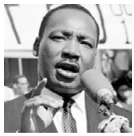
ഡോ. മാർട്ടിൻ ലൂഥർ

യുദ്ധത്തെക്കുറിച്ചും വിപ്ലവത്തെക്കുറിച്ചും നാം കേൾക്കുമ്പോൾ ആദ്യം ഓർമ്മ വരുന്നത് ഹിംസ അഥവാ അക്രമം എന്നാണ്. എന്നാൽ യുദ്ധത്തിലും വിപ്ലവത്തിലും ‘അഹിംസ’ എന്ന തത്വത്തിലൂടെ വിജയം കണ്ടെത്താനാകുമെന്ന് നമ്മെ പഠിപ്പിച്ചിട്ടുണ്ട്.